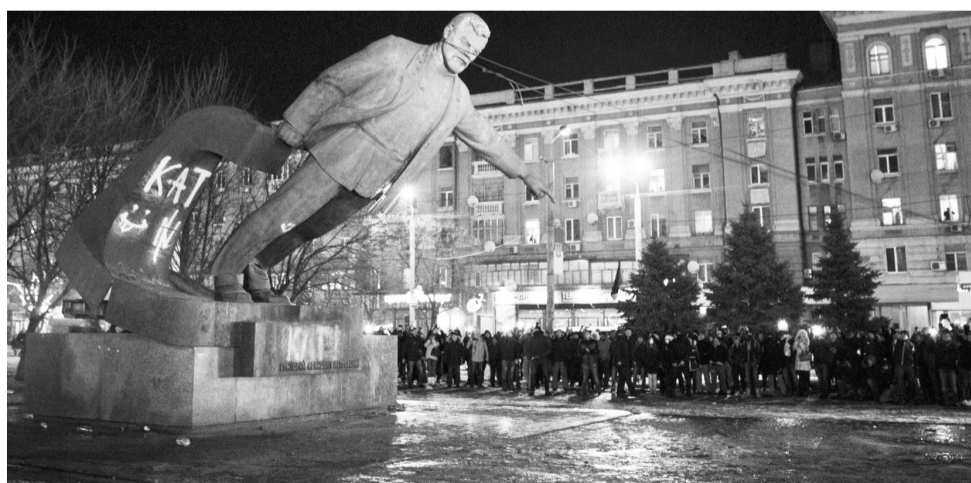
Знесення пам'ятника організатору Голодомору Григорію Петровському у Дніпрі, 29 січня 2016 року.

Зокрема, День українського добровольця відзначають 14 березня, День Гідності та Свободи — 21 листопада. На 21 листопада було перенесено професійне свято